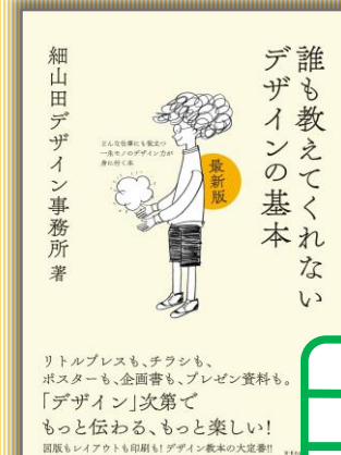
『誰も教えてくれない デザインの基本』 細山田デザイン事務所 (著)