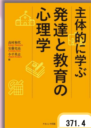
『主体的に学ぶ発達と 教育の心理学』 高村和代 他(著)