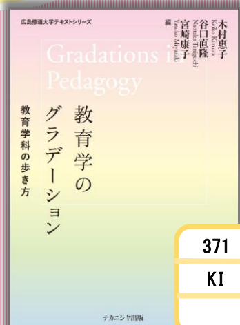
『教育学のグラデーション』 木村恵子 他(著)