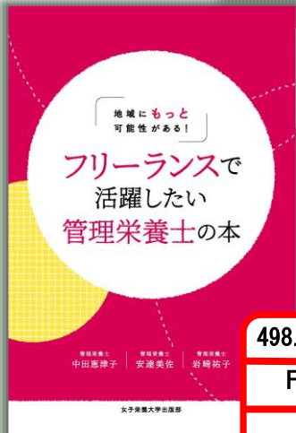
『フリーランスで活躍したい 管理栄養士の本』 女子栄養大学出版部