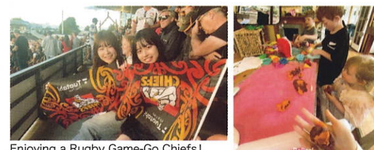
Enjoying a Rugby Game-Go Chiefs!

Attending the 6-week program to New Zealand was the best memory of my life because my communication skills and confidence to take on challenges improved a lot. Living in Japan I have never struggled to explain what I want to say or where I am, since I can use Japanese without any difficulty. However, in New Zealand, I couldn't understand everything, so I actively tried to ask my host family and teachers for help and worked extremely hard to communicate. Through this process, I was able to go to many places, build a close relationship with my host family, and even get good scores in class. As a result, I realized that never giving up, even when facing something completely new, is extremely important. I gained not only English skills but also valuable communication and challenge skills, so I will never forget my time in New Zealand.