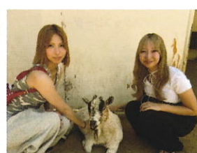
ホストファミリーとOrange County Zooへ

A ホストファミリーが短い滞在中でたくさん予定を考えてくれるので、毎日とても充実していますが、想像以上に体力を使います。体調管理をしっかりしておくとうまくいきます。また、JCC(日本語サークル)の学生との交流もあり、日本からのお土産を持っていくととても喜ばれました。配りやすい個包装のお菓子がおすすめです。