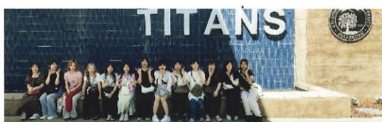
フラトン校前で記念撮影

A 現金は8万円ほど持っていきました。出発前に小松空港でドルに両替しました。ディズニーに行ったときに予想以上の出費があったので、少し余裕をもってそのくらい準備しておいてよかったと感じました。また、食事は思ったよりもかかり、チップの分も含めて考えておく必要があると思います。