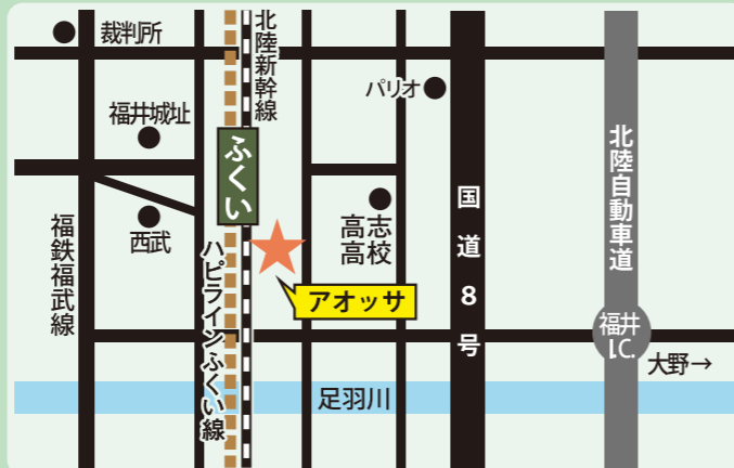
〈アオツサ: 福井市手寄1-4-1〉