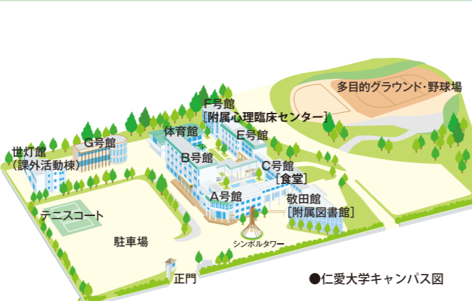
●仁愛大学キャンパス図