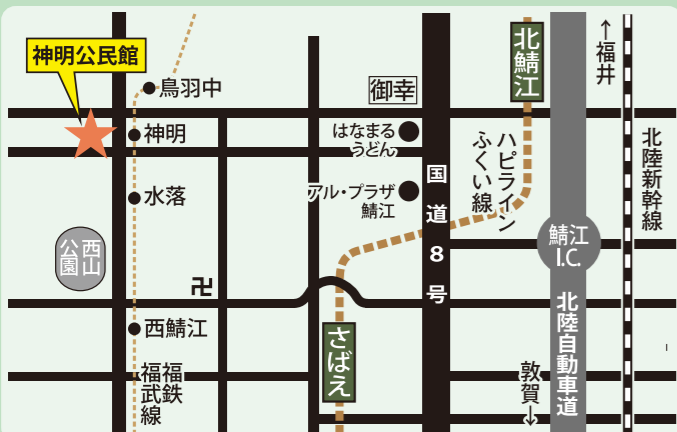
〈神明公民館: 鯖江市三六町1丁目4-12〉