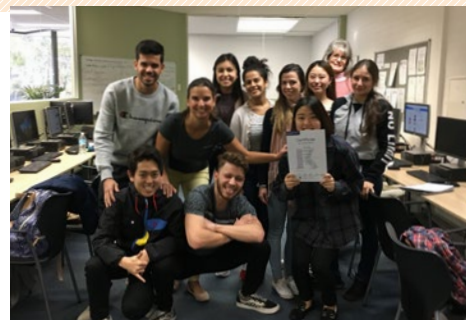
語学学校で、クラスメートたちと。

2018年9月から1年間、個人留学をしました。準備はもちろん現地での銀行開設から家探しまでほとんど自分で行うことはとても大変でしたが、個人留学ならではのいい経験でした。語学学校に通い、放課後は飲食店でアルバイトをしたり、現地の友達と出かけたりしたことも、かけがえのない思い出になりました。たった1年間でしたが、生まれも育ちも福井という井の中の蛙だった私にとって、多文化国家であるオーストラリアは自分の考えや視野を広げてくれる環境でした。