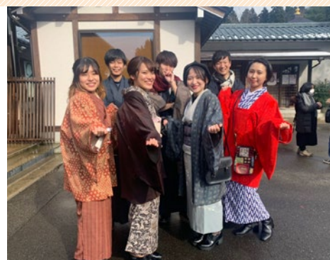
近隣の御誕生寺で、和服を着て地域と交流。