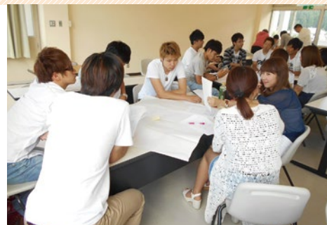
メディアの特性を意識しながらグループワークを実施。

情報が溢れる現代において、多様なメディアが私たちの生活に深く関係しており、伝える情報とメディアとの関係を考察することはとても重要です。この授業では、様々なメディアを分析して特性や役割を学び、メディアの歴史と社会の変容について考えます。新聞、ラジオ、電話、映画、テレビ、スマホ、YouTube、ゆるキャラなど、あらゆるメディアについてグループワークで理解を深め、考察することで物事の本質を問う力、考える力、表現する力を身につけていきます。