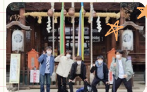
総社大神宮。男子メンバーでばっちり!