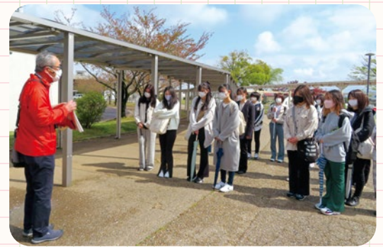
地域のガイドの方が、越前市のことを案内!

「もっと仁愛大学の地元に触れてほしい!」「同級生の仲間との親交を深めてほしい!」。そんな目的を持って、全1年生を対象として4月16日(土)に行われたのが、「地域学習」です。朝9時に武生中央公園に集合し、最初に地域ガイドの方が越前市の歴史やスポットについて説明。5~8人ずつ10班に別れて、それぞれに班長を選び、みんなで行きたい場所を決めて、徒歩で越前市の市街地をめぐる。当日3年生・4年生の先輩も一緒に参加し、1年生を見守りました。わずかな時間ではありましたが、今後、研究活動の舞台となる地元地域に触れるきっかけづくりや、これからの4年間を支え合う先輩や仲間との出会いの場となりました。