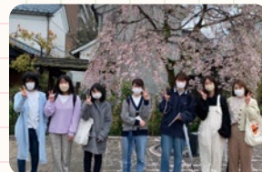
つつい見とれてしまった枝垂れ桜。