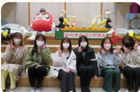
地元絵本作家のかこさとしふるさと絵本館にて。