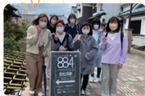
また来たい~おしゃれなカフェを発見。