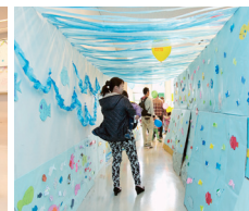
●すいすいすいぞくかん