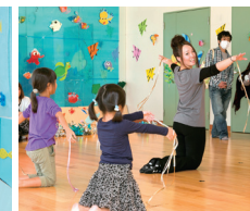
●リトルマーメイドの世界へようこそ ●忍忍シュリケンジャー