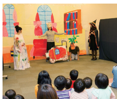
●ラストシンデレラ

フィールドワーク 子どもが楽しめる空間を様々なテーマで制作。大学祭では、大勢の家族連れの来場者がありました。10月26日(土)・27日(日)