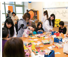
●わくわくどっきり★はかせのへや ●おまつりわっしょい!